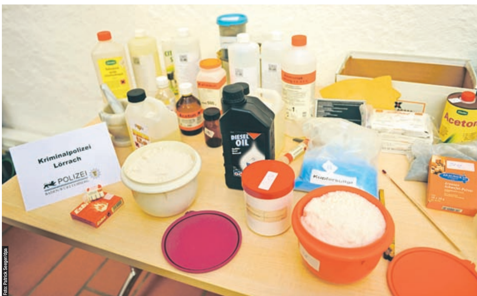
Chemikalien zur Herstellung von Bomben hat die Polizei in Lörrach am Donnerstag (27.08.2009) während einer Pressekonferenz ausgestellt